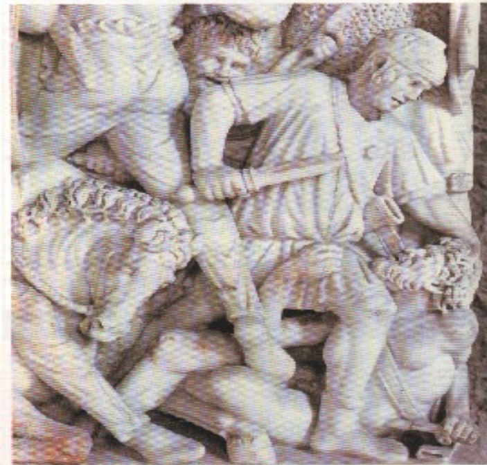
Légionnaire romain. Détail du sarcophage de l'empereur Hostilienus (251 ap. J.-C.) Musée national des Thermes, Rome