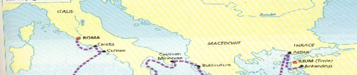
Les voyages d'Énée